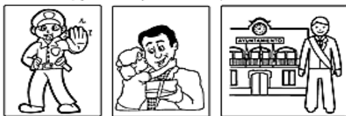
Recorta, pega en tu cuaderno y escribe algunas de las reglas que se tienen que cumplir en: