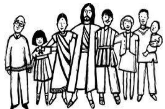
HERMANOS Y HERMANAS EN CRISTO

Necesitamos estar comprometidos tanto con Dios como los unos con los otros en el cuerpo de Cristo. Significa que tenemos que tener la voluntad de cumplir con nuestro compromiso, porque la verdadera comunión entre creyentes es vivir en el amor y servicio.